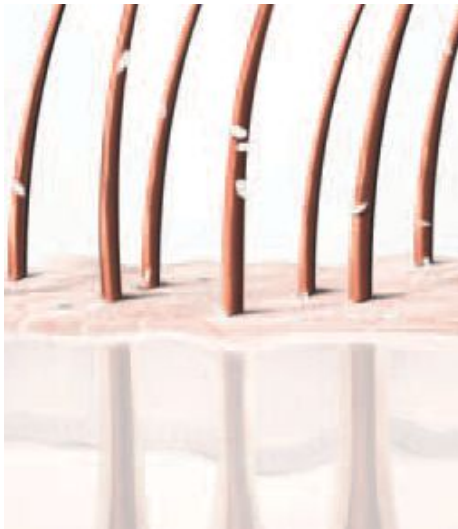
TROCKENE, SENSIBLE KOPFHAUT

Eine gute Beratung ist der Schlüssel, um deinen Kundinnen das ultimative Salonerlebnis zu bieten. Benutze hierfür den speziellen Kerasilk Revitalize Beratungsfächer.